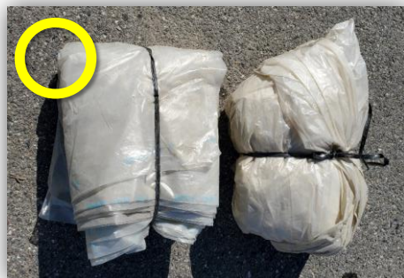
紐でしっかり縛る