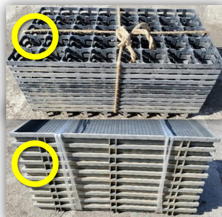
重ねて紐で縛る ※セルトレー プラグトレーは有料の分類Ⅱ