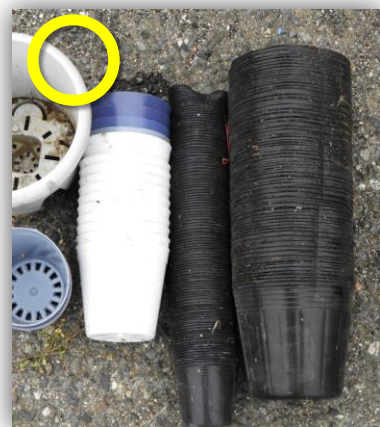
重ねて肥料袋等に入れて持ち込む (農業生産用に限る)